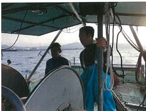
指導者の先輩漁師から熱心に話しを聞く