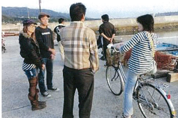
左が研修生夫妻、まずは皆さんにご挨拶