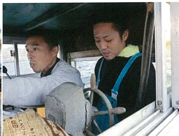
操船体験！意外とまっすぐ進むのが難しい～