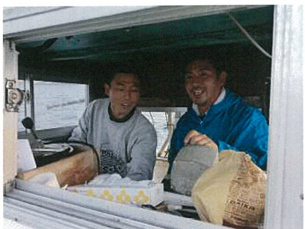
この日は先輩研修生（出身：埼玉県）も同乗